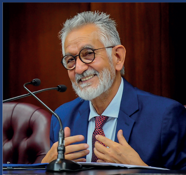
Alberto Rodríguez Saá