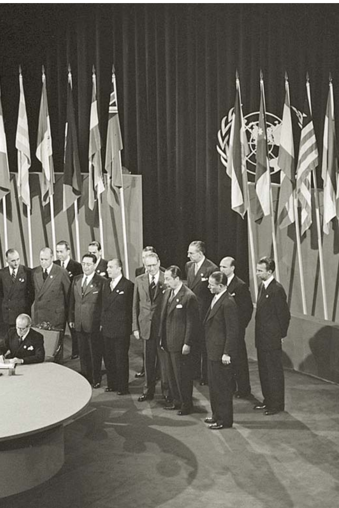
En 1945, representantes de 50 países se reunieron en San Francisco en la Conferencia de las Naciones Unidas sobre Organización Internacional, para redactar la Carta de las Naciones Unidas.

Nadie debe ser sometido, sin acuerdo previo, a envíos masivos de correo electrónico no solicitado (spam), de archivos vinculados u otros tipos de correspondencia invasiva. (Artículo 5).